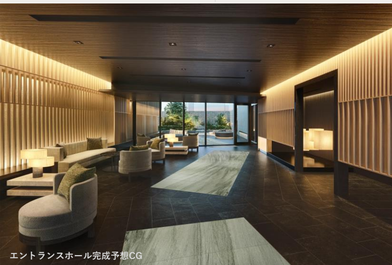
エントランスホール完成予想CG